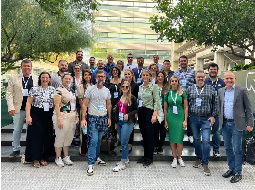
Imersão na Europa – Embaixadores ELUME