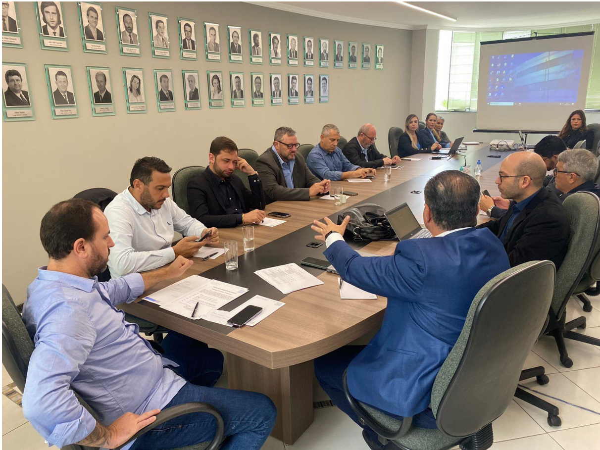
ASSEMBLEIA – CIM-AMFRI