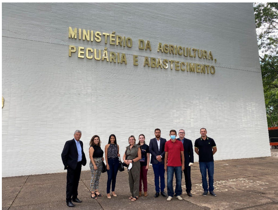
Seminário do Projeto ConSIM – MAPA Brasília - DF