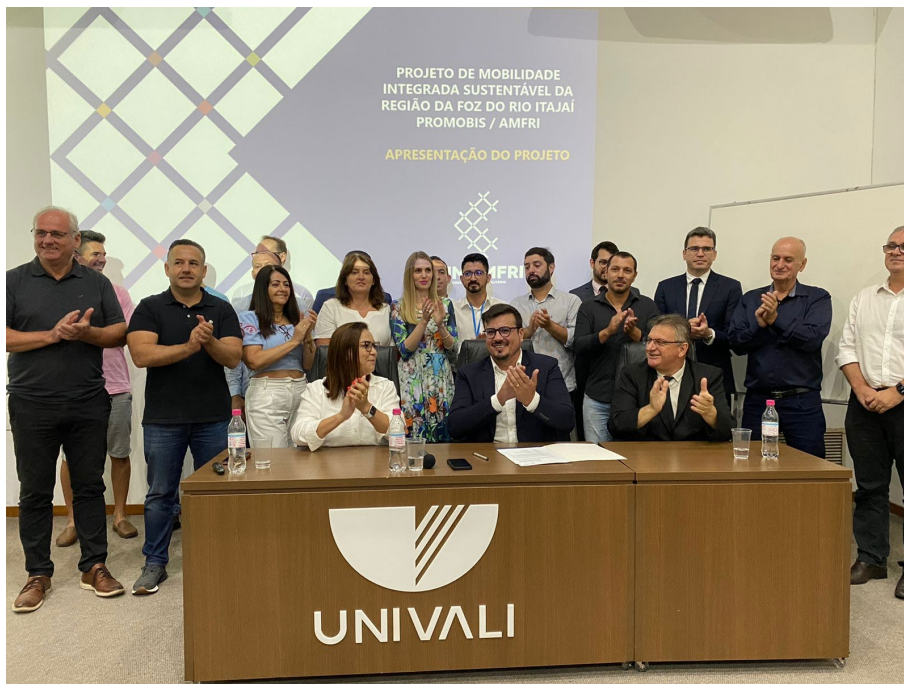
Instalação da COMLEG / PROMOBIS - Univali Itajaí - SC