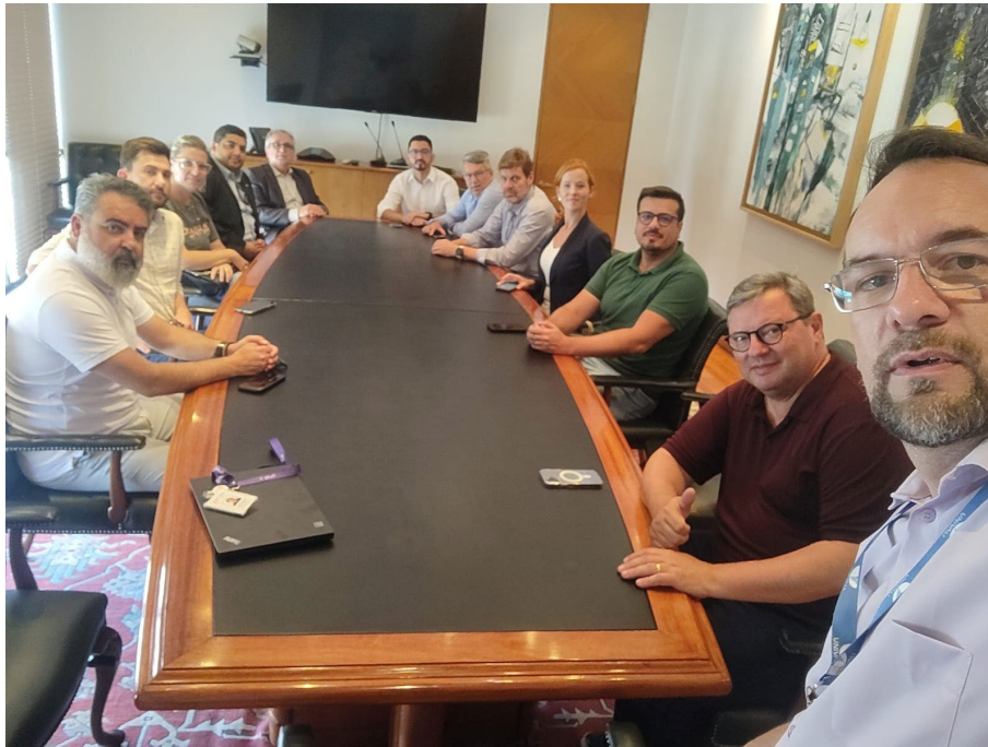
Missão Técnica PROMOBIS – Ministério do Transporte Santiago do Chile