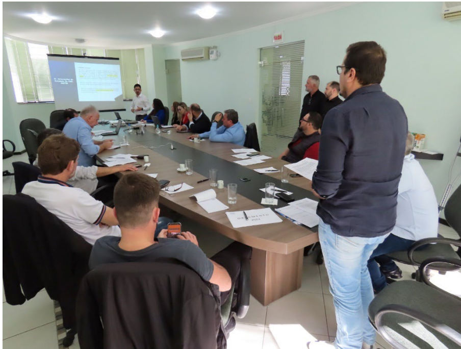
Assembleia Geral Extraordinária – CIM-AMFRI Itajaí - SC