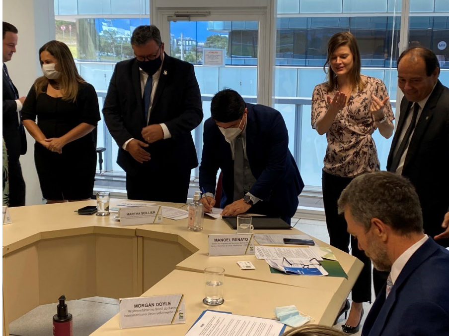
Assinatura do Contrato de Estruturação da PPP da Educação Infantil – SEPII Brasília - DF