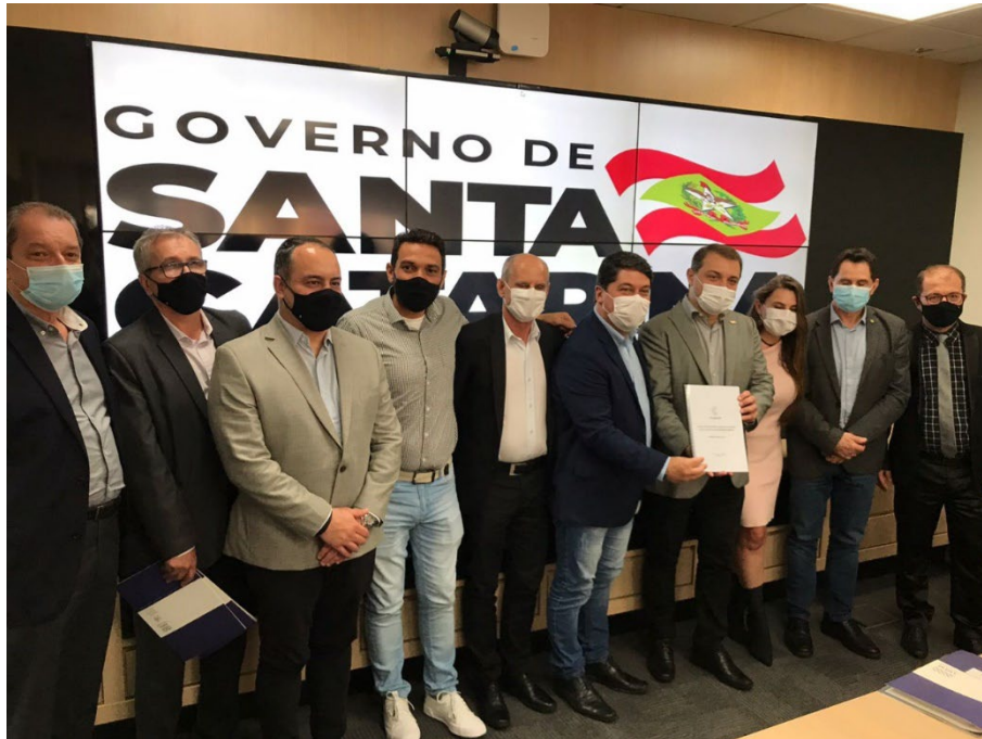
Apresentação PROMOBÍ Governador – Centro Administrativo Florianópolis - SC