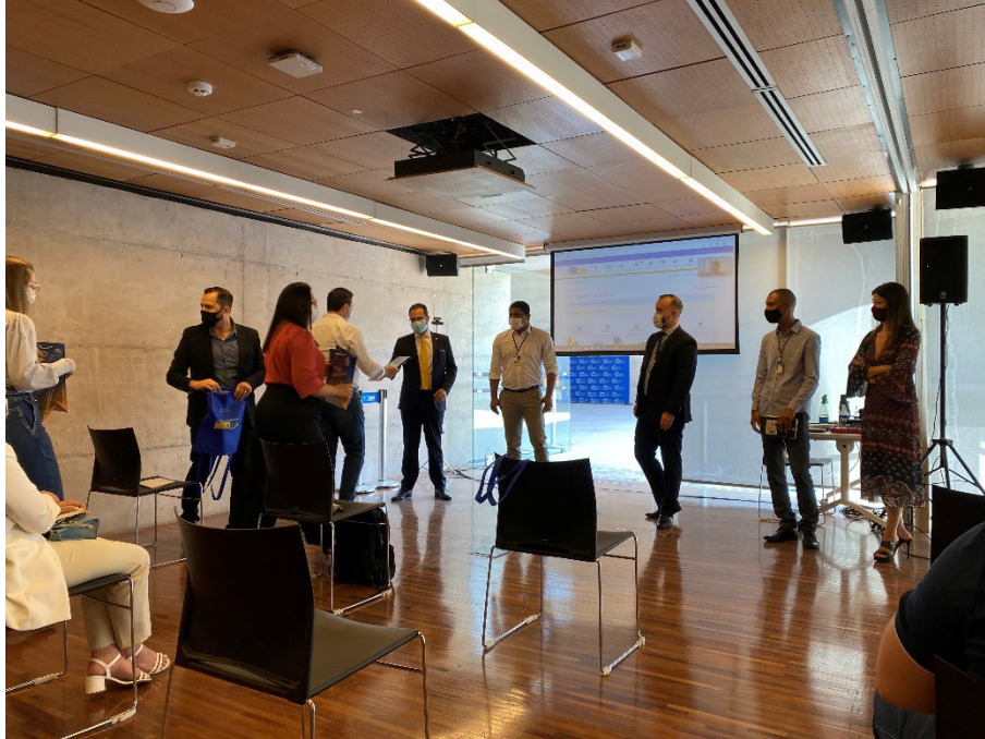
Gestão de Convênios – Confederação Nacional dos Municípios Brasília - DF