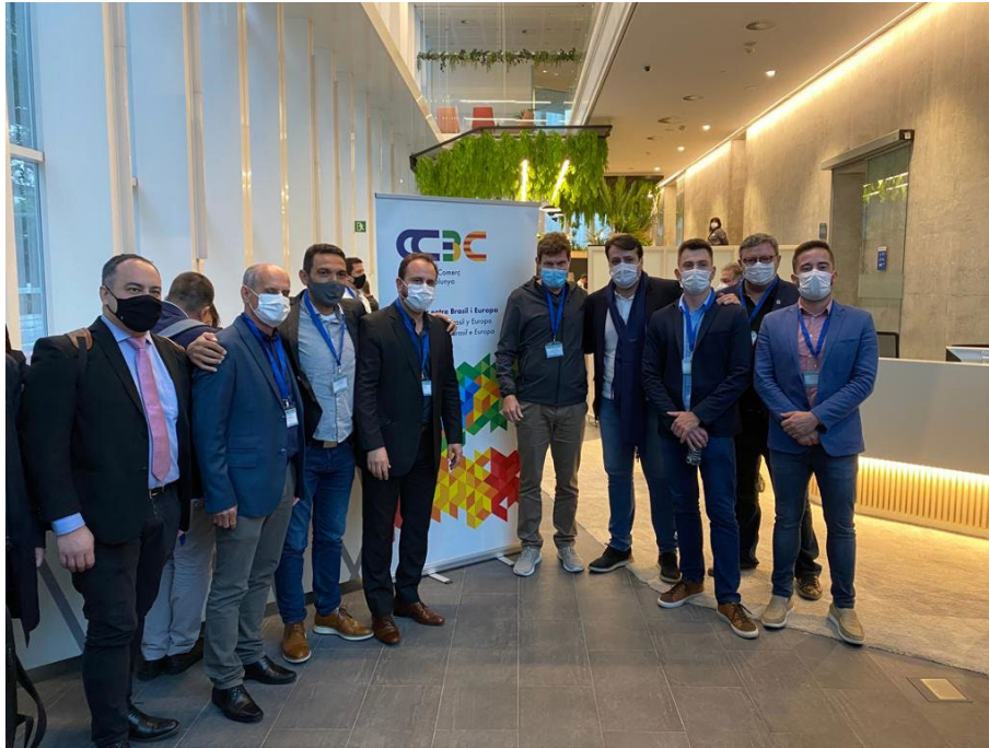
Câmara de Comércio Brasil Catalunha - Barcelona - ES