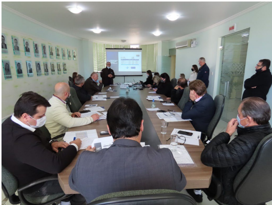
Assembleia Geral de Prefeitos - AMFRI Itajaí - SC