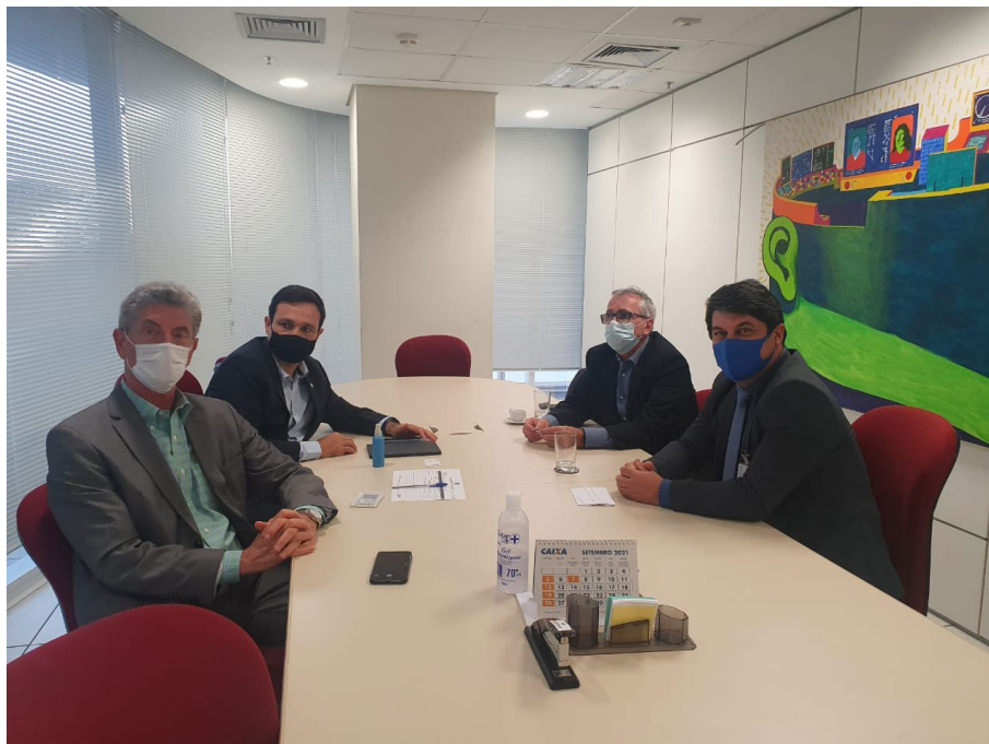
PPP – Educação Infantil - SEPEI Brasília - DF